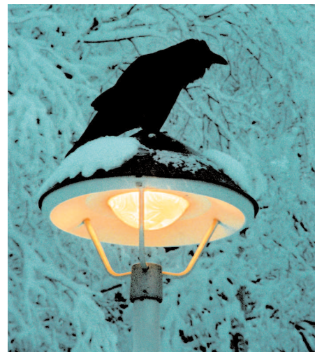
Krkavec velký ( Corvus corax ) je častým zimním hostem univerzitního kampusu ve Fairbanksu

Když se na sklonku poslední doby ledové (asi před 11 500 lety) otevřel průchod pevninským ledovcem k jihu, vydaly se jím skupinky lovců. V severoamerických prérích se setkaly s početnými stády koní (např. Equus scotti ), bizonů ( Bison bison antiquus ), velbloudů Camelus besternus , s mamuty ( Mammuthus primigenius ) a velkými pozemními lenochody (např. Megalonyx jeffersonii ). Tato zvířata neznala strach z člověka a stávala se jeho snadnou kořistí. Většina velkých čtvernohých savců (koně, mamuti, pozemní lenochodi, velbloudi a velké šelmy) vyhynula v Severní Americe brzy po skončení doby ledové. Není dosud jasné, do jaké míry se o to zasloužil člověk a jakou roli sehrála změna klimatických poměrů. Archeologická naleziště stád mamutů a koní ubitých lidmi však naznačují, že šetrné využívání přírodních zdrojů zřejmě není člověku vrozeno. Lidé k němu dospívají až pod tlakem nutnosti a činí jej součástí své kultury, ať už jde o kmenová tabu či Kjótský protokol. Protože předkové dnešních severoamerických indiánů, stejně jako zakladatelů velkých říší ve Střední a Jižní Americe, přišli z Aljašky, můžeme tento ledový kraj pova-